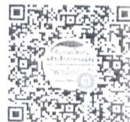
QR Code โลกใบนี้ “ติดตามเด็กออกกลางคัน สพฐ.”

สำนักนโยบายและแผนการศึกษาขั้นพื้นฐาน กลุ่มวิจัยและพัฒนานโยบาย โทร. ๐ ๒๒๘๐ ๕๕๓๐ , ๐ ๒๒๘๘ ๕๘๓๙