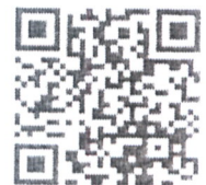
QR Code สิ่งที่ส่งมาด้วย ๑ - ๔