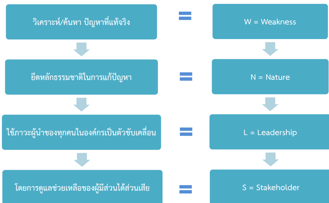
แผนภูมิที่ 2.2 รูปแบบการทำงานของ LNW's style การบริหารจัดการสถานศึกษาเพื่อพัฒนาคุณภาพผู้เรียน

L (Leadership) คือ ภาวะผู้นำ ผู้บริหาร ครูและนักเรียนทุกคนต้องเป็นผู้นำในการจัดกิจกรรมการเรียนการสอน แบ่งหน้าที่ความรับผิดชอบในแต่ละด้าน โดยผลัดกันทำหน้าที่ผู้นำผู้ตามที่ดี N (Nature) คือการใช้หลักธรรมชาติซึ่งสอดคล้องกับหลักธรรมทางพุทธศาสนาบูรณาการในการจัดกิจกรรมการเรียนการสอน W (Weakness) คือจุดอ่อนของโรงเรียนซึ่งเป็นปัญหาที่ทางโรงเรียนต้องการทำการแก้ไข โดยใช้ปัญหาเป็นฐาน S (Stakeholder) คือผู้มีส่วนได้ส่วนเสียทุกภาคส่วนให้การดูแลช่วยเหลือ และให้ความร่วมมือในการแก้ปัญหา มีรูปแบบการทำงานดังแผนภูมิที่ 2.2