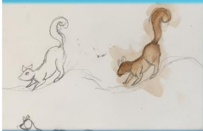
ขั้นที่ 1 วาดจนเกิดความชำนาญ