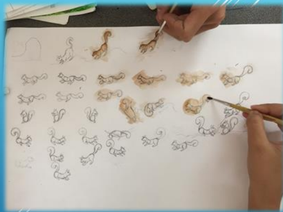
ขั้นที่ 2 ฝึกการระบายสี