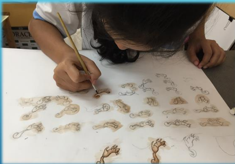
ฝึกจนเกิดความชำนาญ