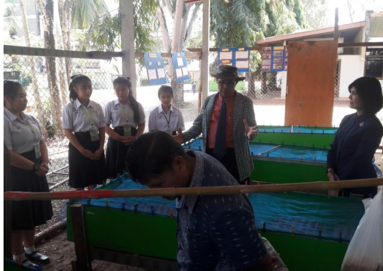
ภาพที่ 10 กิจกรรมการเลี้ยงจิ้งหรีด