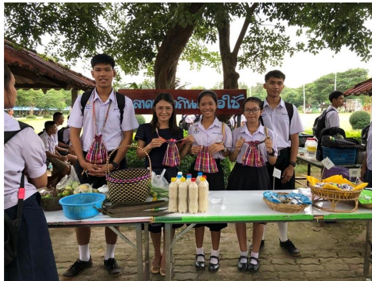
ภาพที่ 13 กิจกรรมการจำหน่ายผลิตภัณฑ์ของนักเรียน