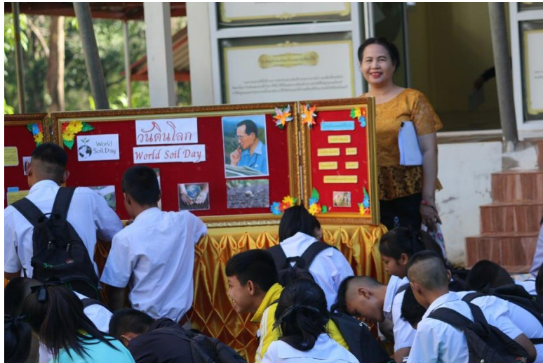
ภาพที่ 3 กิจกรรมการเรียนรู้ศาสตร์พระราชา