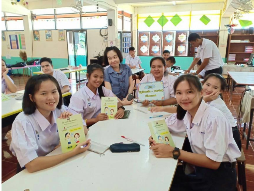
ภาพที่ 14 กิจกรรมการบันทึกบัญชีรายรับ-รายจ่าย