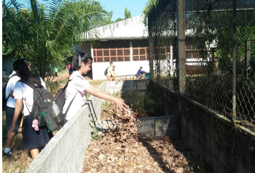
ภาพที่ 6 กิจกรรมการผลิตปุ๋ยหมักในโรงเรียนโคกสีวิทยาสรรค์