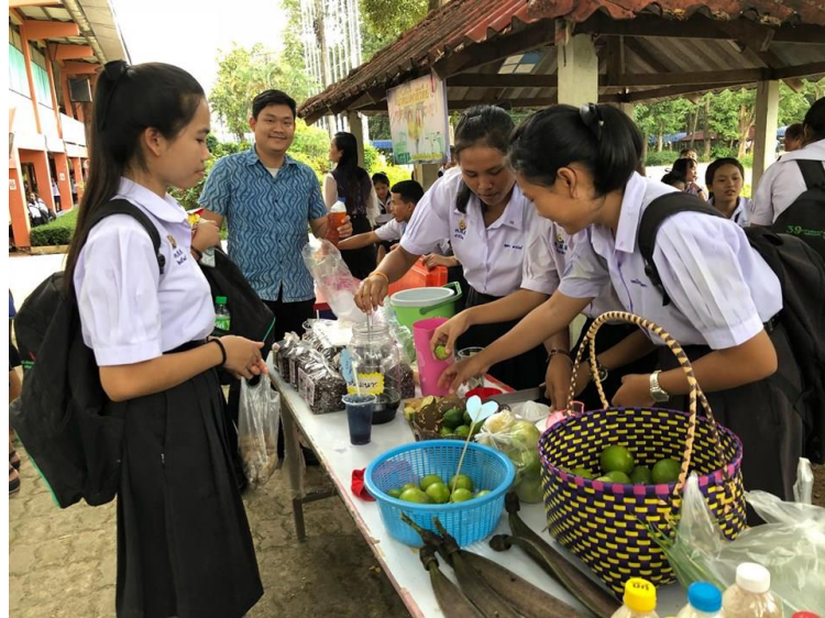
ภาพที่ 12 กิจกรรมการจำหน่ายสินค้าของนักเรียนในตลาดเกลือกินเกลือใช้