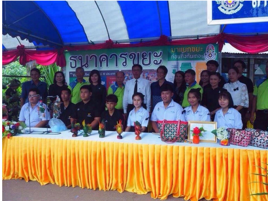
ภาพที่ 16 แสดงชิ้นงานของนักเรียนจากขยะสร้างค่าลดปัญหาสิ่งแวดล้อม