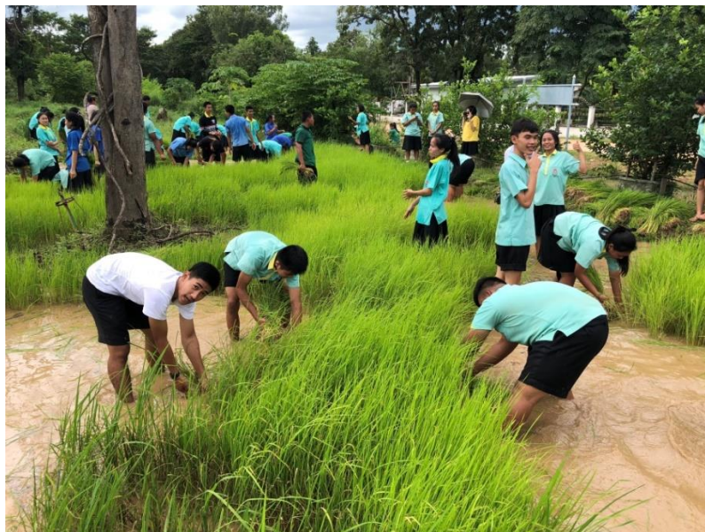
ภาพที่ 4 กิจกรรมการถอนกล้าในแปลงนาสาธิตโรงเรียนโคกสีวิทยาสรรค์