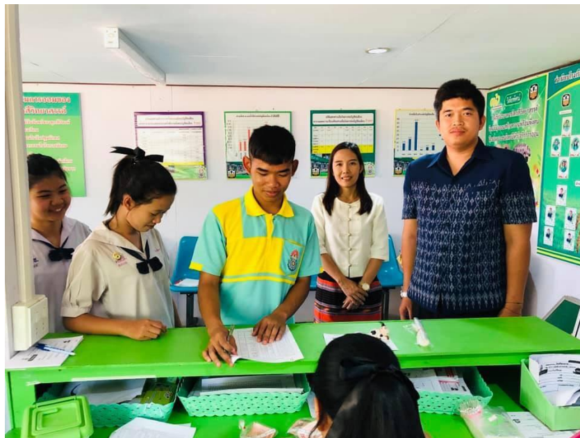
ภาพที่ 19 กิจกรรมการฝากเงินในโรงเรียนธนาคาร