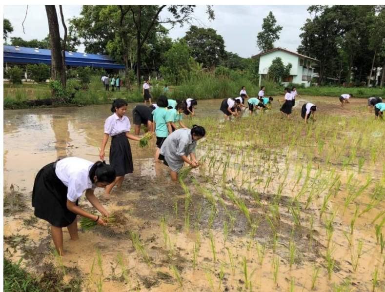
ภาพที่ 5 กิจกรรมการปลูกข้าวในแปลงนาสาธิตโรงเรียนโคกสีวิทยาสรรค์