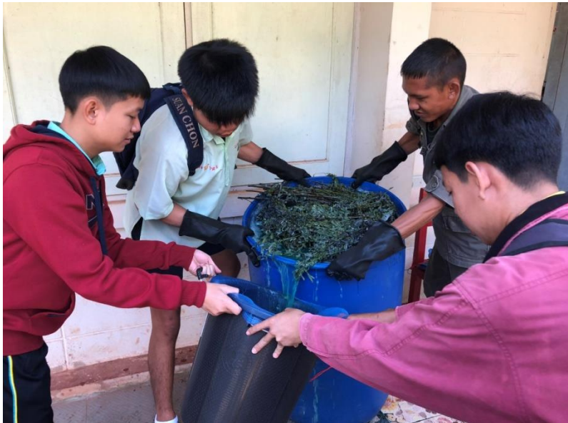
ภาพที่ 9 กิจกรรมการหมักคราม