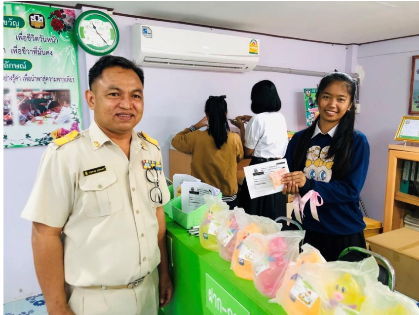
ภาพที่ 18 กิจกรรมการเปิดบัญชีภายในโรงเรียนธนาคาร