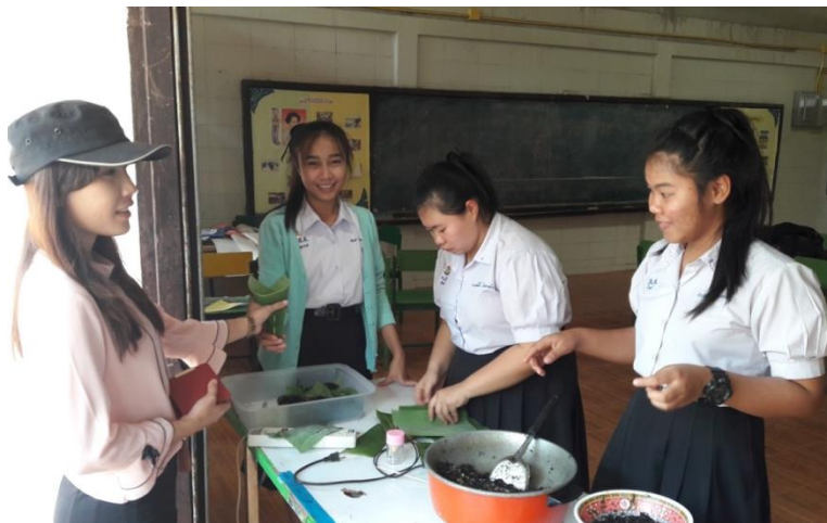
ภาพที่ 11 กิจกรรมการจำหน่ายจิ้งหรีดทอด