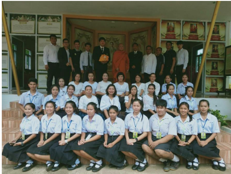
ภาพที่ 2 เปิดอาคารศาสตร์พระราชา