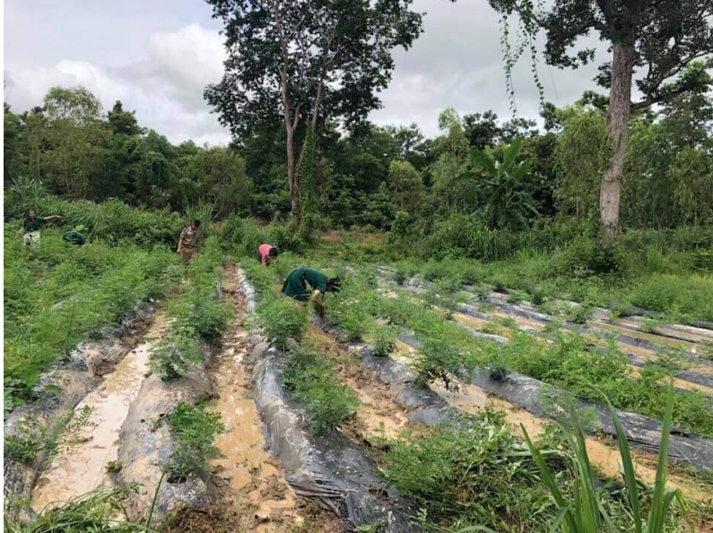
ภาพที่ 8 กิจกรรมการปลูกคราม