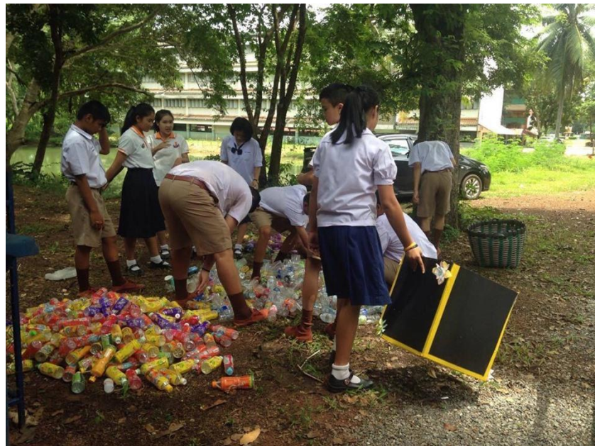
ภาพที่ 17 การคัดแยกขยะ