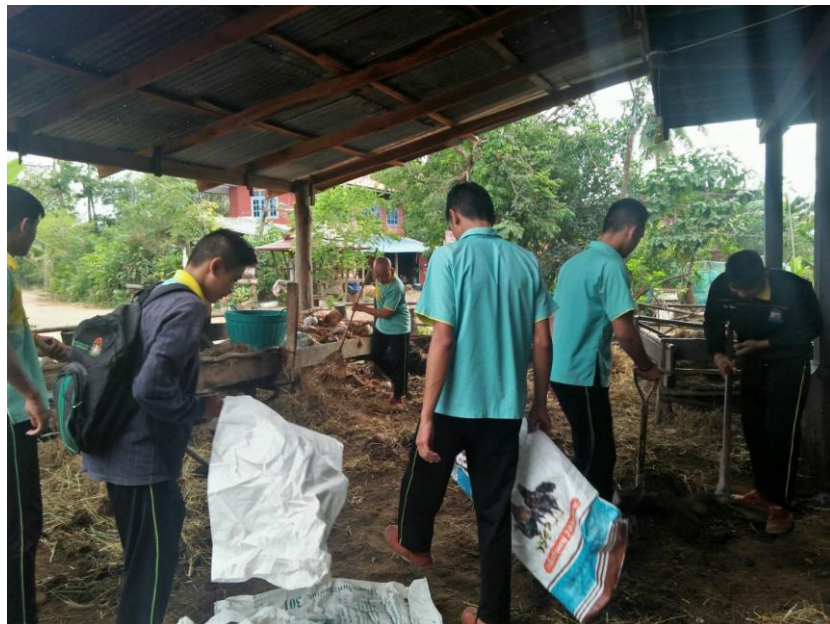
ภาพที่ 7 กิจกรรมการจัดเตรียมวัสดุในการผลิตปุ๋ยหมัก