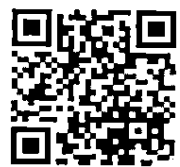
QR Code สิ่งที่ส่งมาด้วย ๑ - ๔