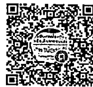
QR Code ไลน์กลุ่ม “ติดตามเด็กออกกลางคัน สนม.”